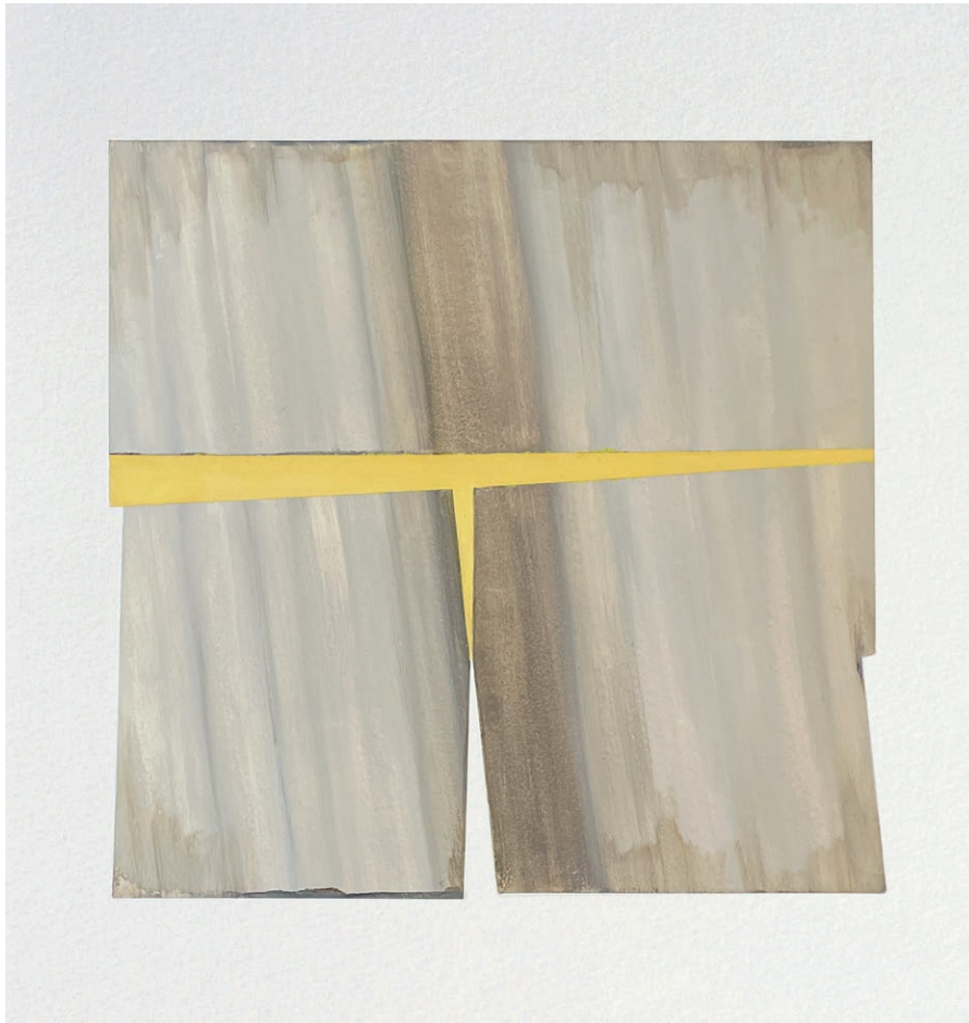
Quatuor - Or , peinture par Noémie Langlois-Meurinne