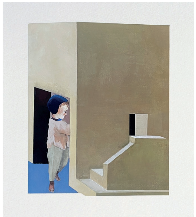
Quatuor - Vadim Ora , peinture par Noémi Langlois-Meurinne