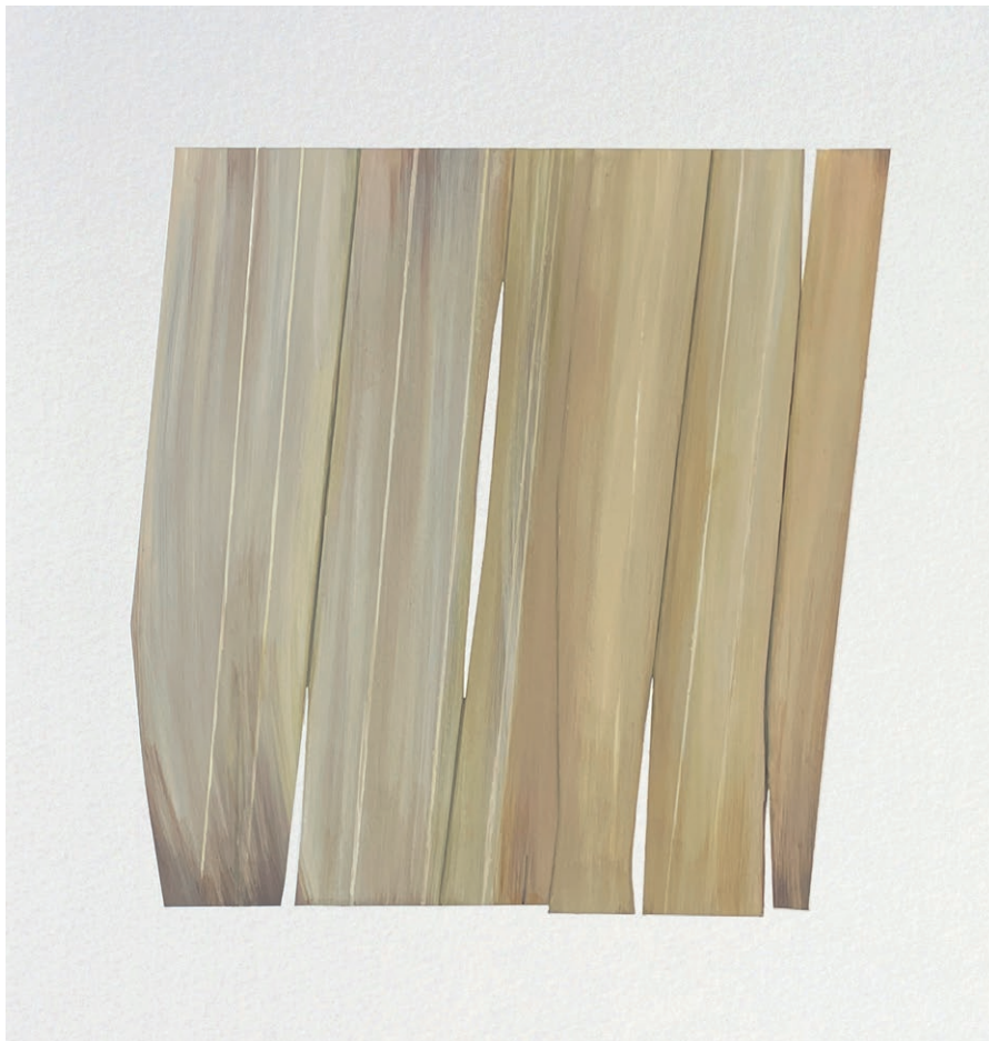
Quatuor - Aquo , peinture par Noémie Langlois-Meurinne