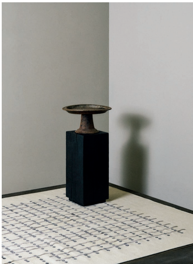
Echo exhibition, by Studio KO for Galerie Diurne

Fidèle à cette dynamique, la galerie poursuit son projet de tisser des pièces d'exception, au croisement de l'art, de la matière et de la création contemporaine.