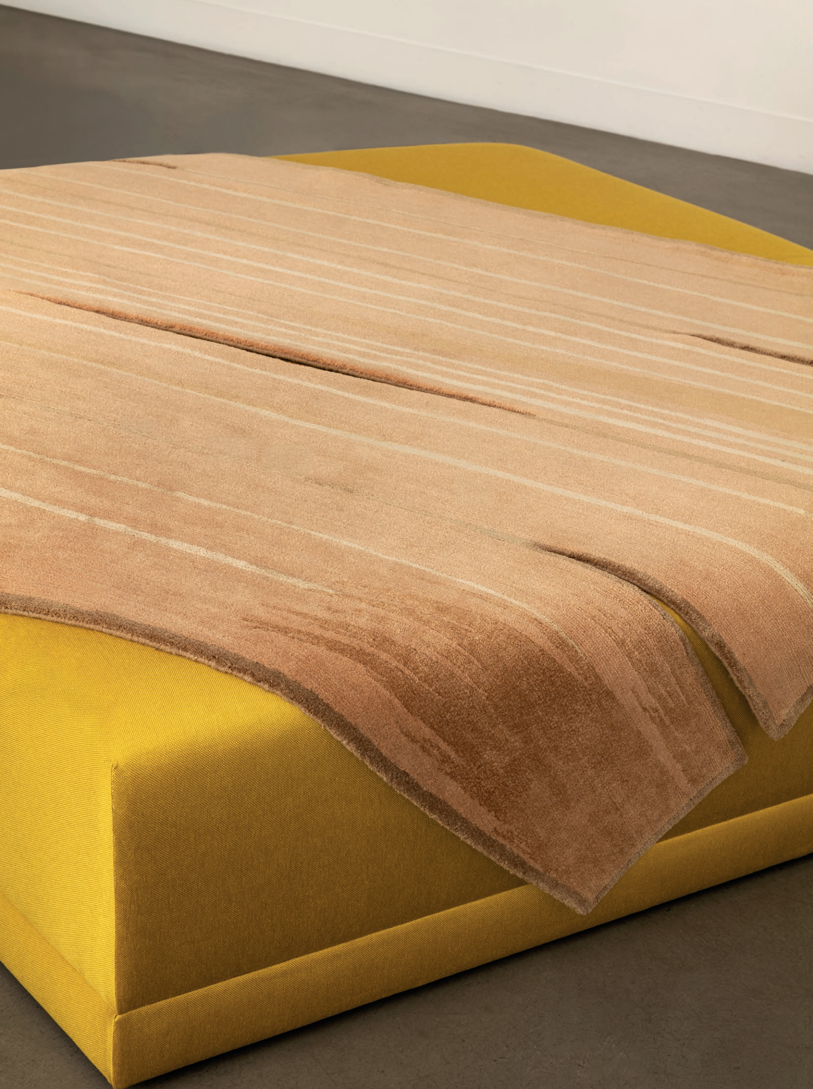
Tapis QUA 04 01 - Aquo , noué main en laine et soie