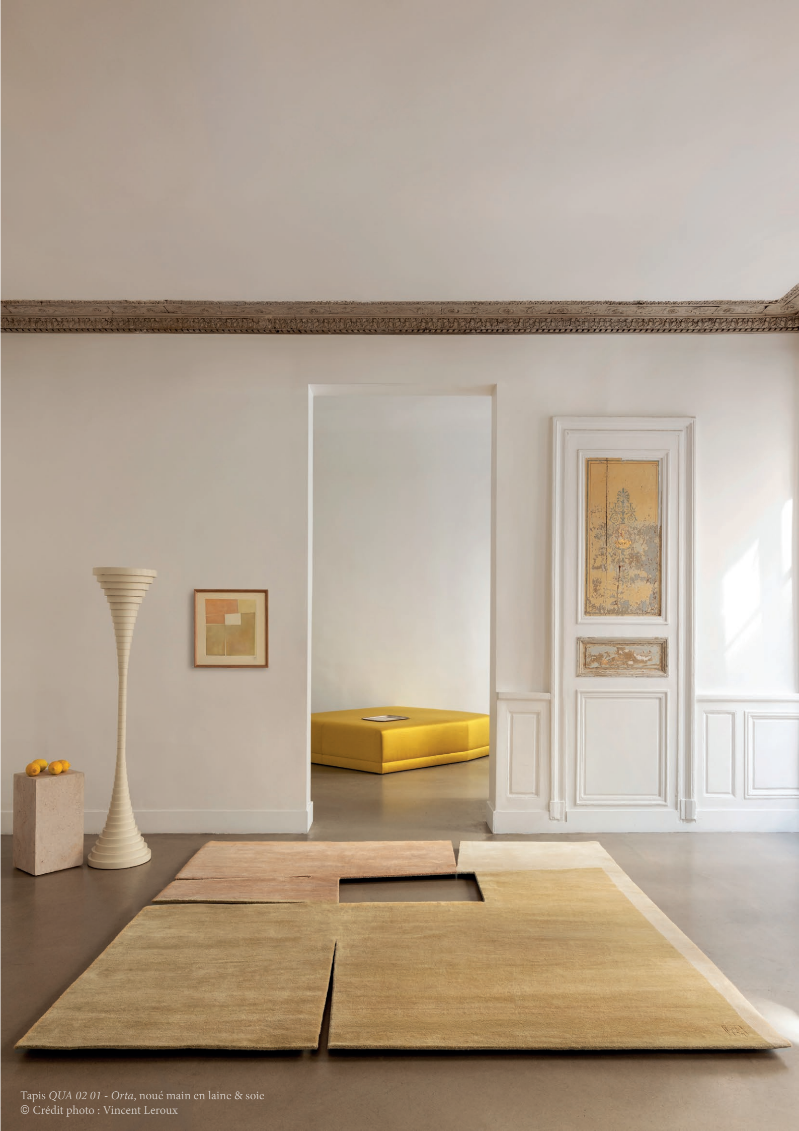
Tapis QUA 02 01 - Orta, noué main en laine & soie