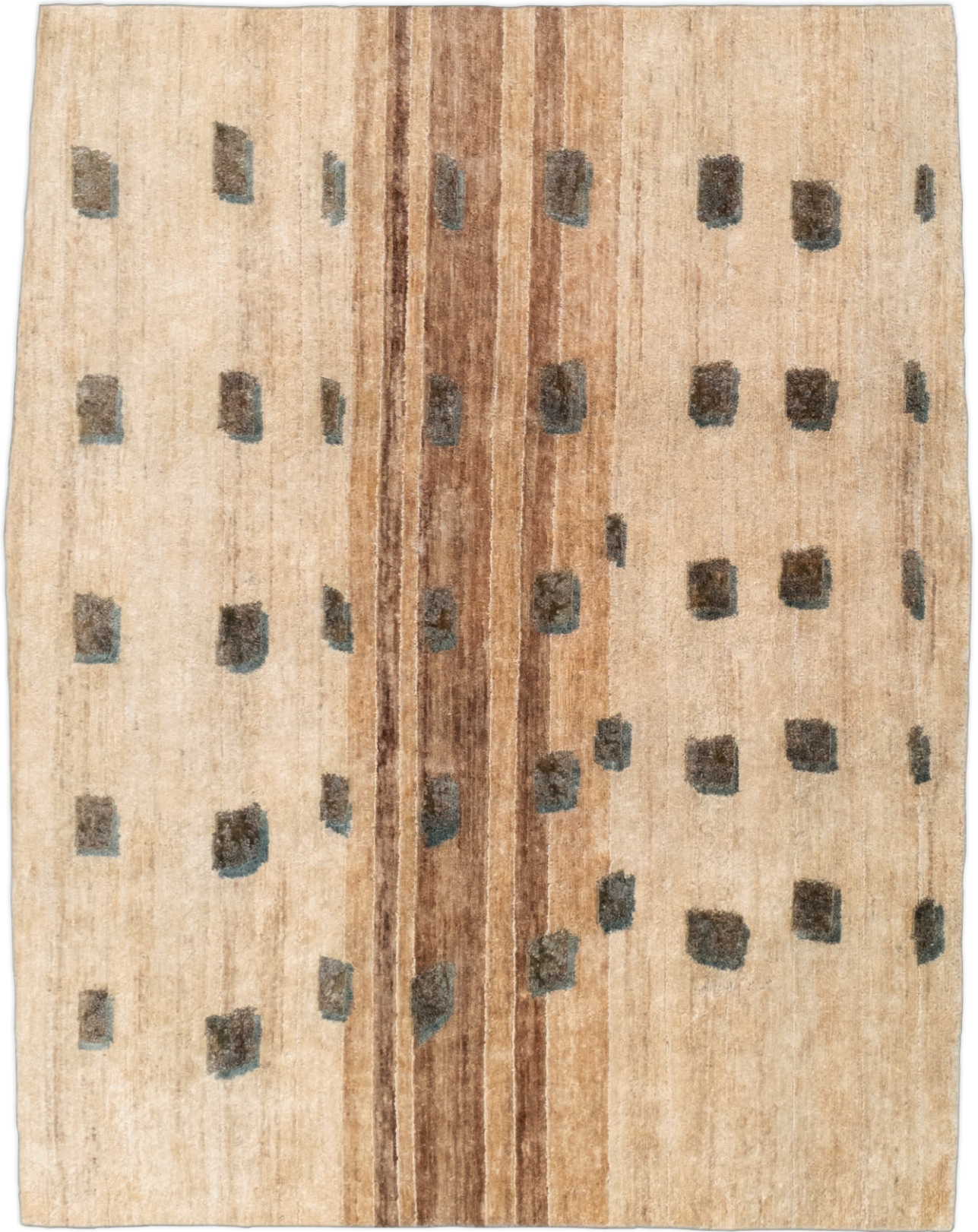
Tapis QUA 03 01 - Atour , noué main en chanvre