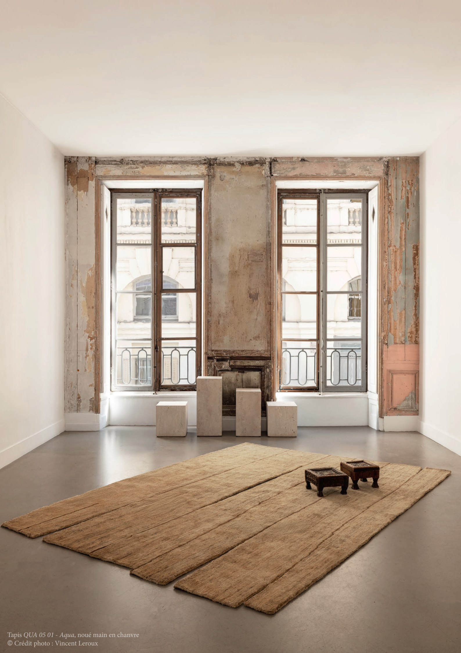
Tapis QUA 05 01 - Aqua, noué main en chanvre