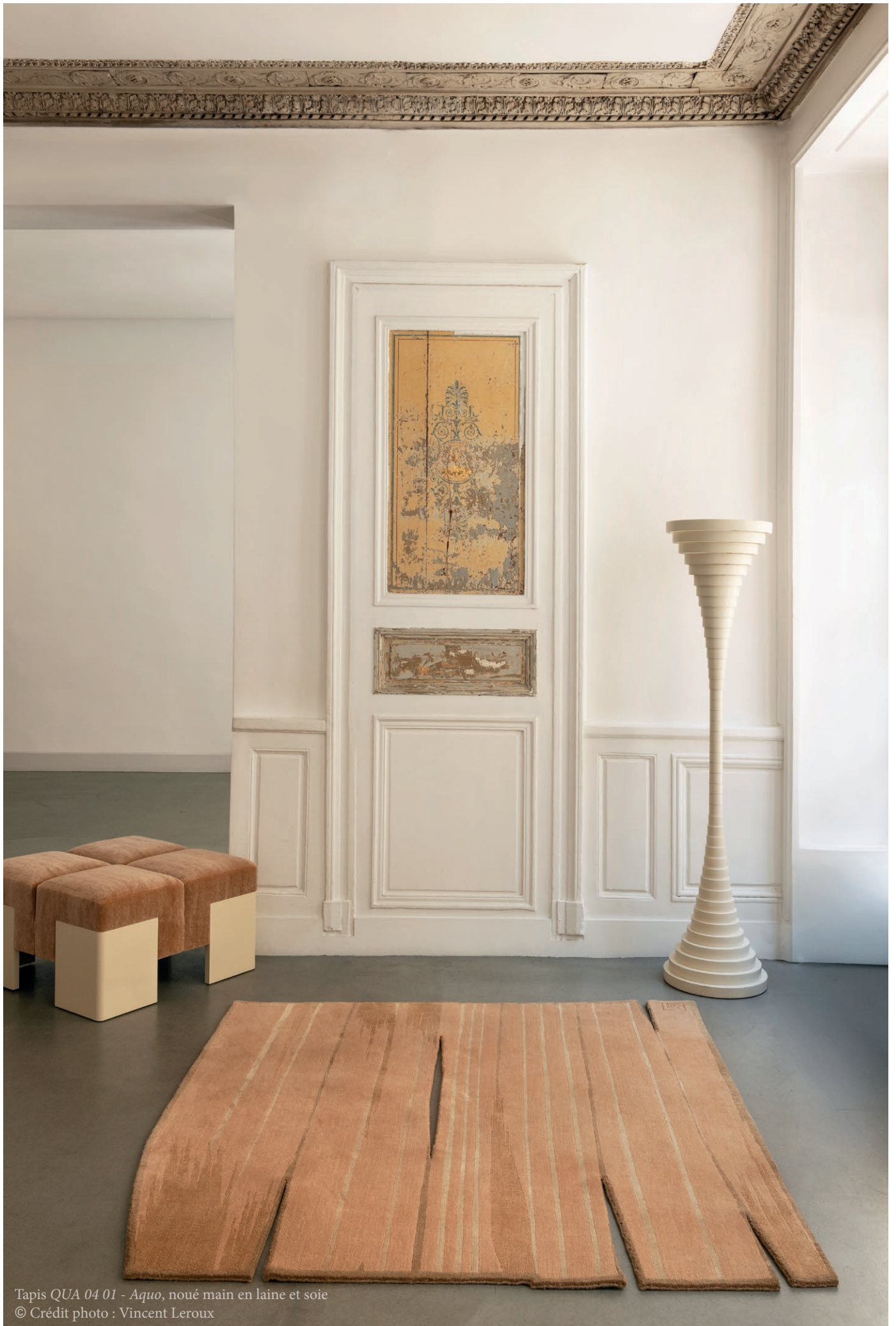
Tapis QUA 04 01 - Aquo , noué main en laine et soie