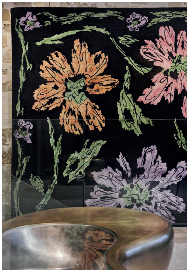
Exposition Elements , par Mattia Bonetti pour Galerie Diurne